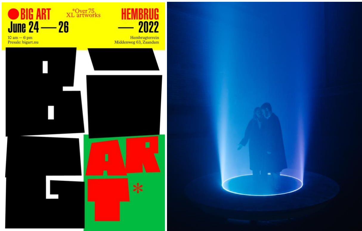
Links: campagnebeeld van Studio Laucke Siebein. Rechts: Zalan Szakacs via Chrysalid Art

Het Hembrugterrein ligt op de grens tussen Amsterdam en Zaandam en is uitstekend te bereiken met de auto. Bezoekers kunnen hun auto kosteloos op het terrein parkeren. Vanaf de Dam in Amsterdam is het 30 minuten fietsen naar BIG ART en vanaf station Zaandam is het terrein te bereiken met bus 63.