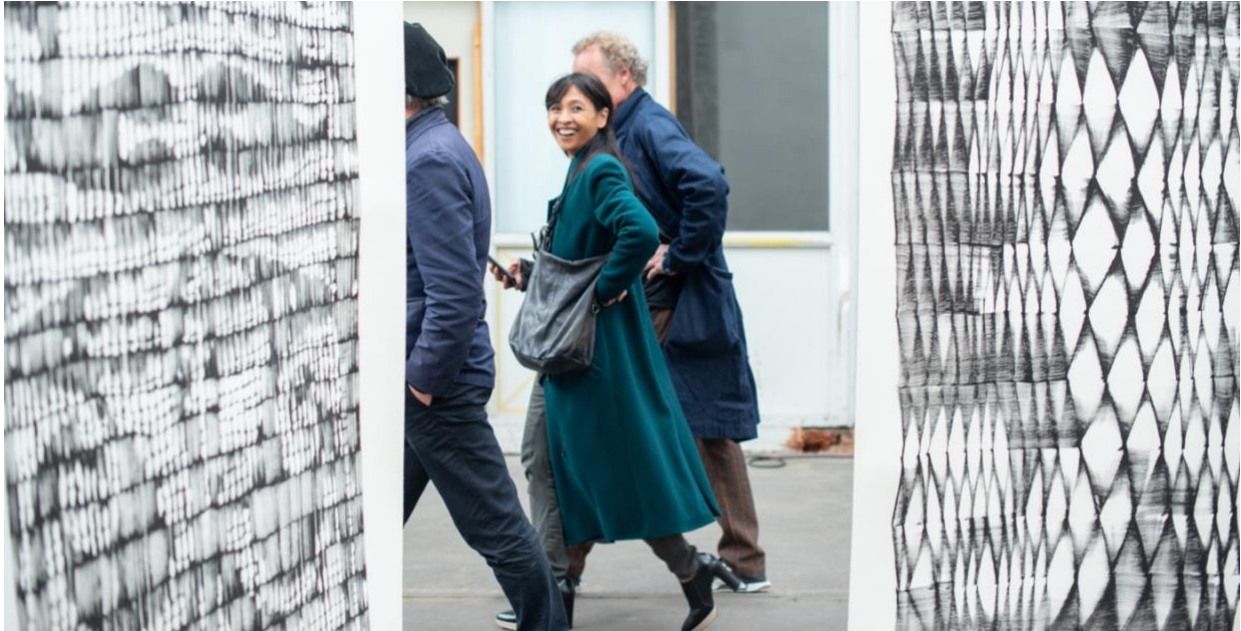
XL tekeningen van Vincent de Boer via Franzis Engels