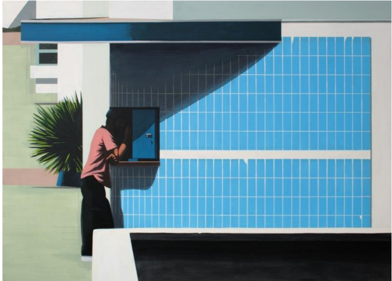
Links: XL collages van Bonnita Postma. Rechts: gestileerde schilderkunst van Mattijs van den Bosch