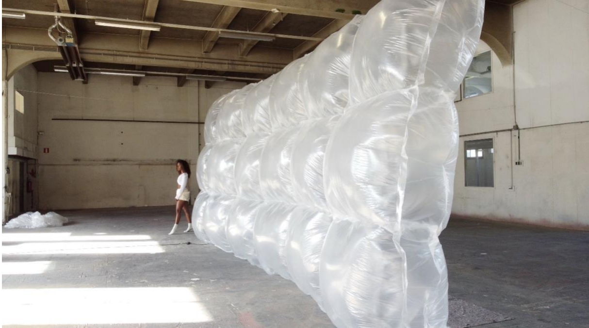
Grote blow up van Sheray of Light