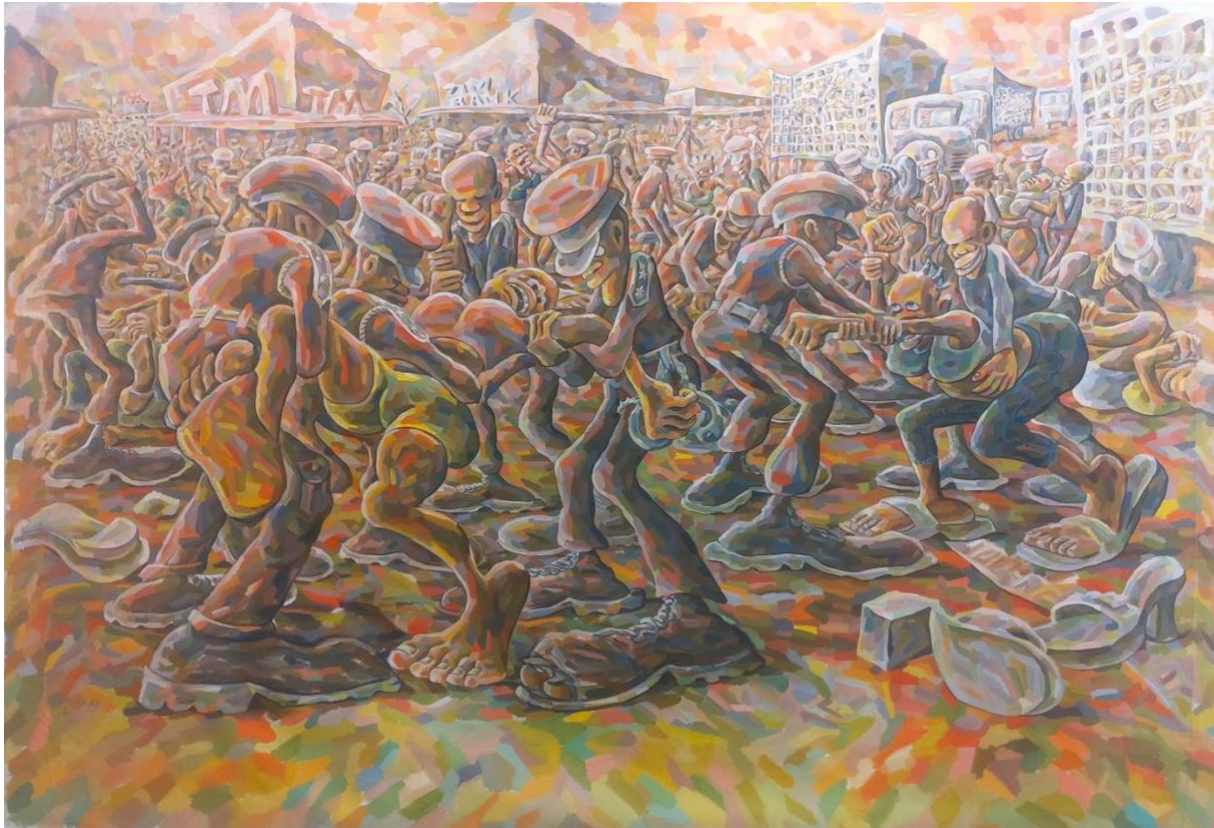
Groot schilderij van Lovemore Kambudzi (PLAY room)

Het laatste weekend van september strijkt XL kunstplatform BIG ART opnieuw neer in het Amsterdamse Bajeskwartier. Met ruim 100 grote kunstwerken belooft dit de grootste editie ooit te worden. Het Hoofdgebouw van de voormalige Bijlmerbajes vormt het decor voor sculpturen, schilderijen, lichtkunstwerken, tekeningen, fotografie, video en installatiekunst van formaat. De rauwe, casco ruimtes van het roemruchte gebouw zorgen voor een unieke sfeer. Alle kunstwerken zijn te kijk en te koop.