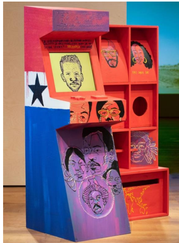
Links: schets van Jochem Esser (Root Gallery), rechts: installatie van Brian Elstak