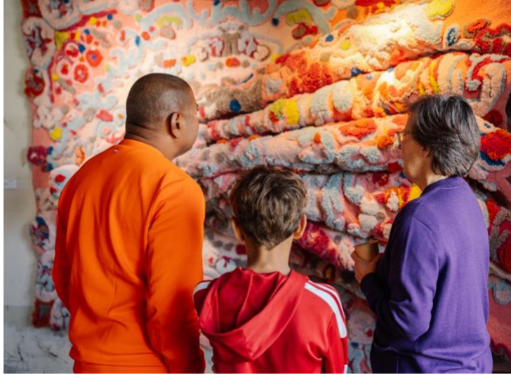
Links: Het Slotervaart, rechts: House of Rubber | Rademakers Gallery