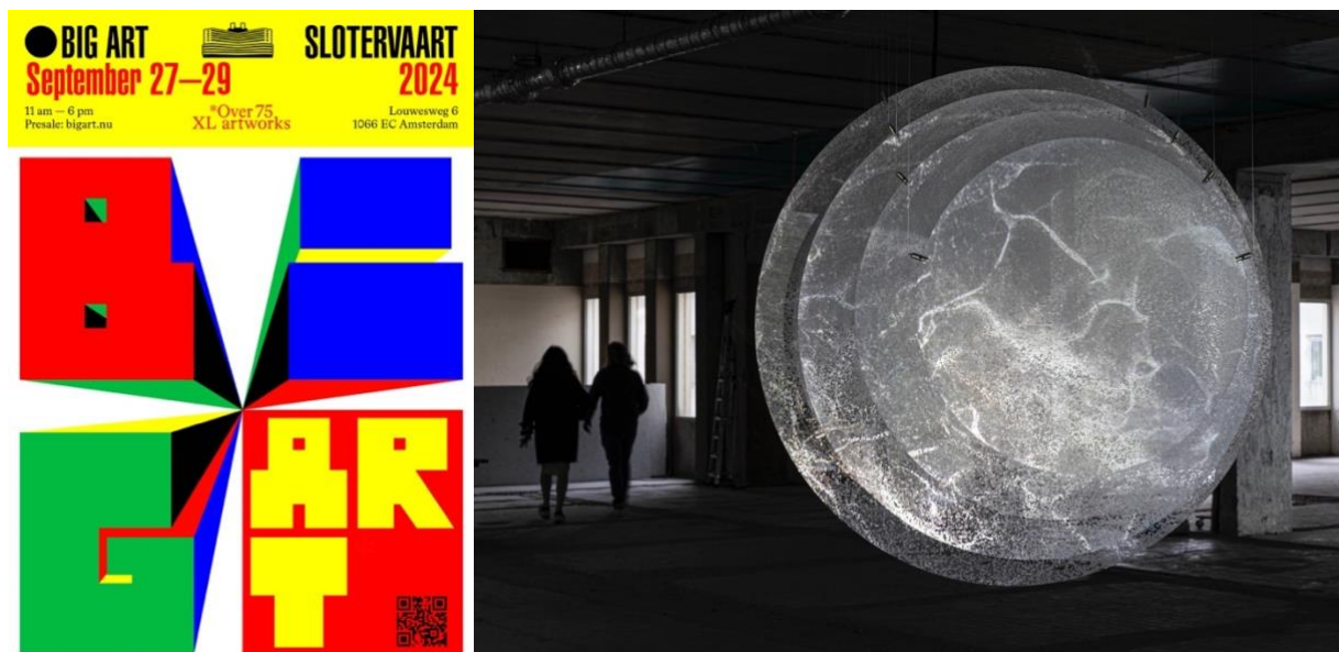
Links: campagnebeeld van Dirk Laucke, rechts: interactieve installatie van Clifton Mahangoe

Van vrijdag 27 september tot en met zondag 29 september is BIG ART terug in Amsterdam. Deze tiende editie strijkt het pop-up kunstplatform neer in weer een bijzonder gebouw: het bekende Slotervaartziekenhuis, Een toonbeeld van brutalistische architectuur. Op de hoogste verdiepingen van dit Amsterdamse icoon zijn een weekend lang ruim 75 grote kunstwerken te zien, met een fenomenaal uitzicht over de stad.