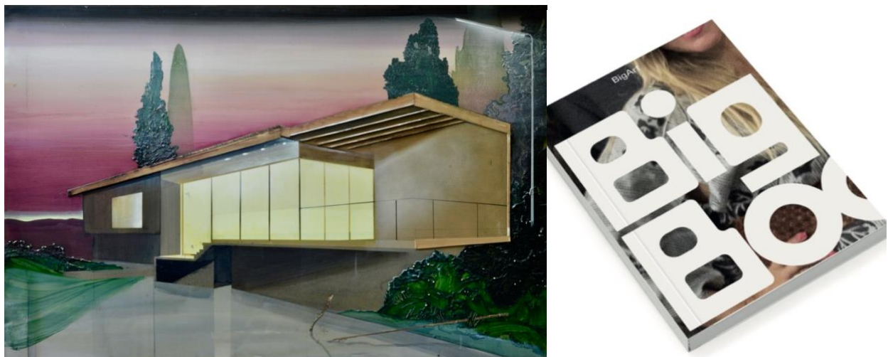
Links: nieuw werk van Toon Berghahn, rechts: Big Book door Studio Laucke Siebein

Komende week vindt de tiende editie van kunstplatform BIG ART plaats in het voormalige Slotervaartziekenhuis. Meer dan 100 kunstenaars presenteren hun werk op de hoogste verdiepingen van dit iconische gebouw. Opnieuw vormt een bijzondere locatie het decor voor een bonte mix van deelnemers. Ter ere van het jubileum wordt een beeldend boek gepresenteerd dat terugblijkt op 10 keer BIG ART.